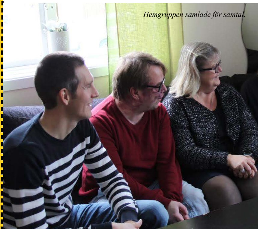
Hemgruppen samlade för samtal.

Ju mer vi har att göra desto snabbare går tiden. Men varför går tiden alltid långsammare om det vi gör är något som vi inte tycker är roligt? Det var en fråga som vi inte kunde hitta svar på, trots att vi kunde slå fast att det är härligt att få det gjort, det som behöver göras.